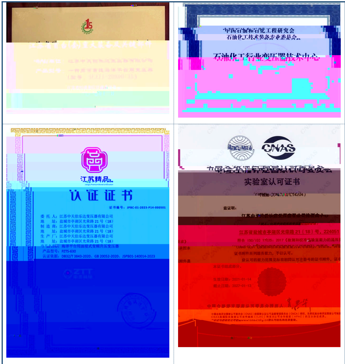
图 公司技术创新荣誉

公司高度重视研发人才队伍建设，通过引进、培养和激励相结合的方式，打造了一支高素质、专业化的技术团队。目前，公司研发团队由75名专业技术人员组成，中高级职称21人。团队在机械、电气设计等领域具有丰富的经验，并与西安交通大学、南通大学、盐城工学院等高校及沈阳变压器研究院等科研机构建立了紧密的产学研合作关系。